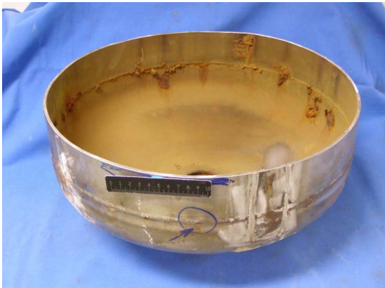
Figura 1: Parte del depósito que presentaba la fuga. Se observa corrosión junto al cordón de soldadura.