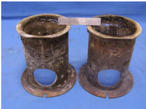
Figura 1: Cámaras de combustión muy deterioradas por corrosión.